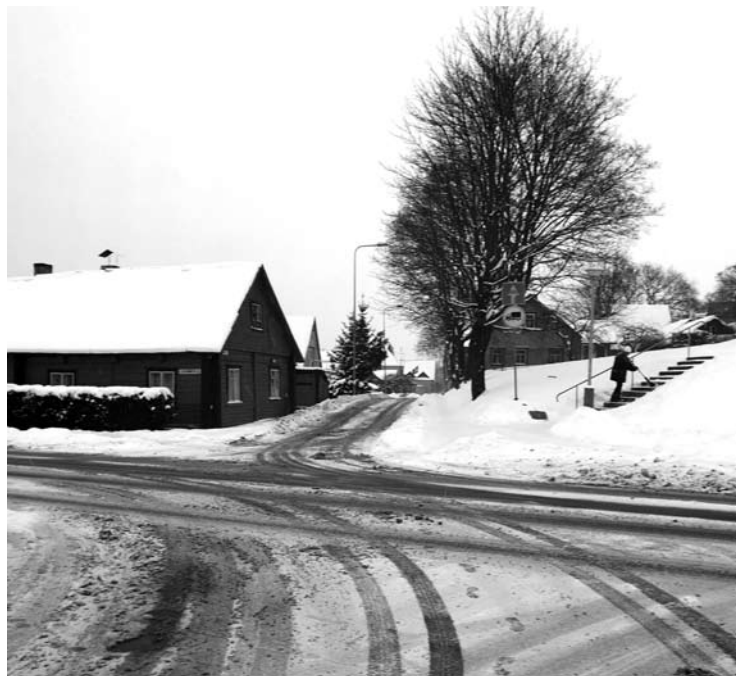
Graži žiema sniegą nuo šaligatvių valantiems darbininkams toli gražu ne džiaugsmą kelia.

Šaligatvių valytojai sniegą kasa ant gatvių, o kelius valanti sunkiasvorė technika jį suverčia atgal ant šaligatvių. „Ne tik mieste ši problema. Pavyzdžiui, skambino dar-