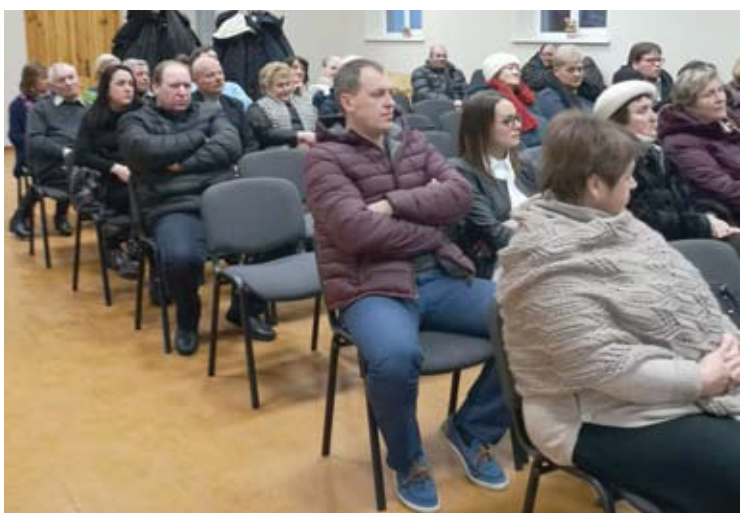
Kavarskiečiai aktyviai klausinėjo rajono valdžios ir tarpusavyje keitėsi replikomis.